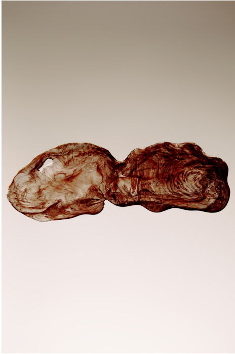
Tre imponenti pilastri bidimensionali di zucchero — SWEET PILLARS