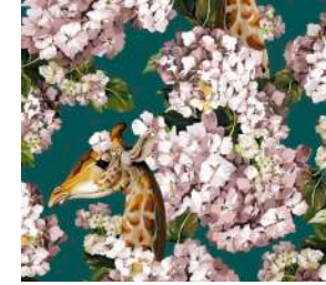
The hortense dream Ottanio