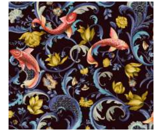
Italian Garden Blue