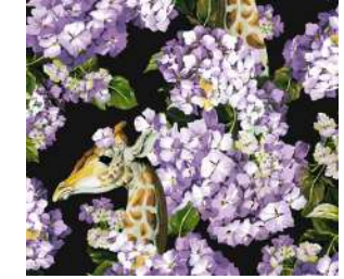
The hortense dream Purple