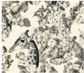
The hortense dream Cream