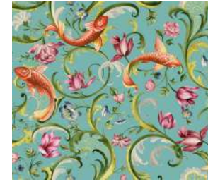
Italian Garden Turquoise, Amb. p. 18