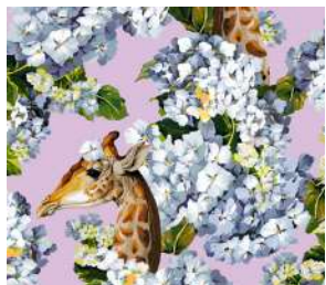
The hortense dream Lilac