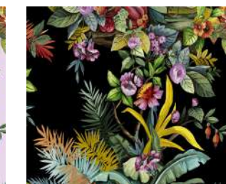
Jungle Exotic Black