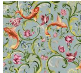
Italian Garden Sage