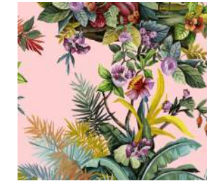
Jungle Exotic Rose