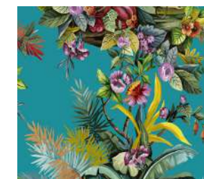
Jungle Exotic Turquoise, Amb. p. 34