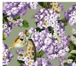
The hortense dream Oil