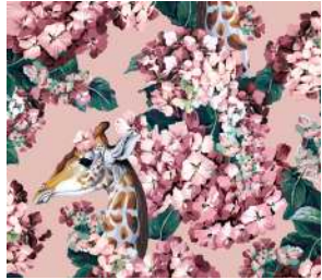
The hortense dream Rose , Amb. p. 24