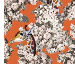
The hortense dream Orange