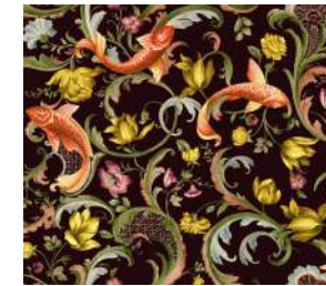
Italian Garden Midnight