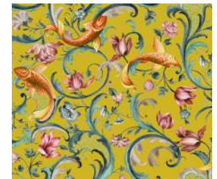
Italian Garden Velvet