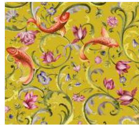
Italian Garden Yellow