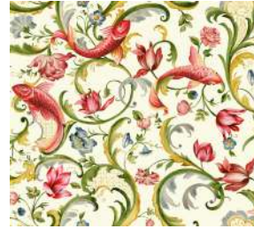
Italian Garden White, Amb. p. 14