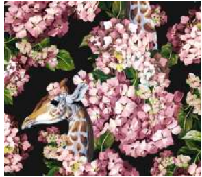
The hortense dream Black rose