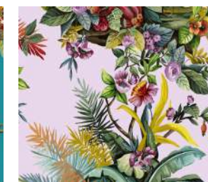
Jungle Exotic Lilac, Amb. p. 38