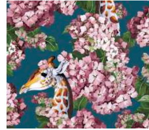
The hortense dream Blu Pink