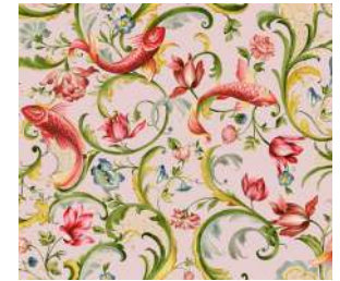
Italian Garden Powder pink