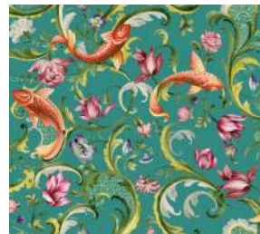
Italian Garden Ocean