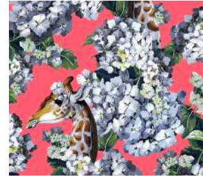
The hortense dream Coral