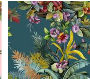
Jungle Exotic Avio