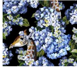
The hortense dream Blu Black