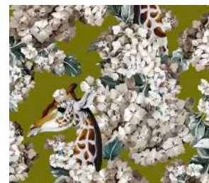
The hortense dream Oliva