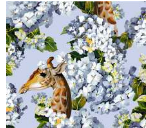
The hortense dream Heavenly