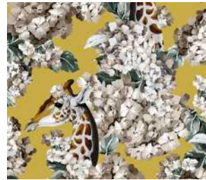
The hortense dream Gold