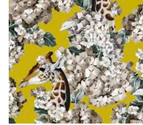
The hortense dream Sun