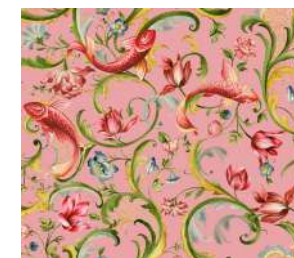
Italian Garden Lipstick