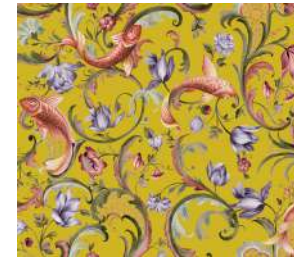
Italian Garden Violet