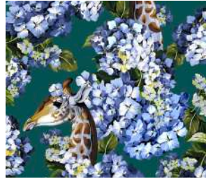
The hortense dream Petrol, Amb. p. 28