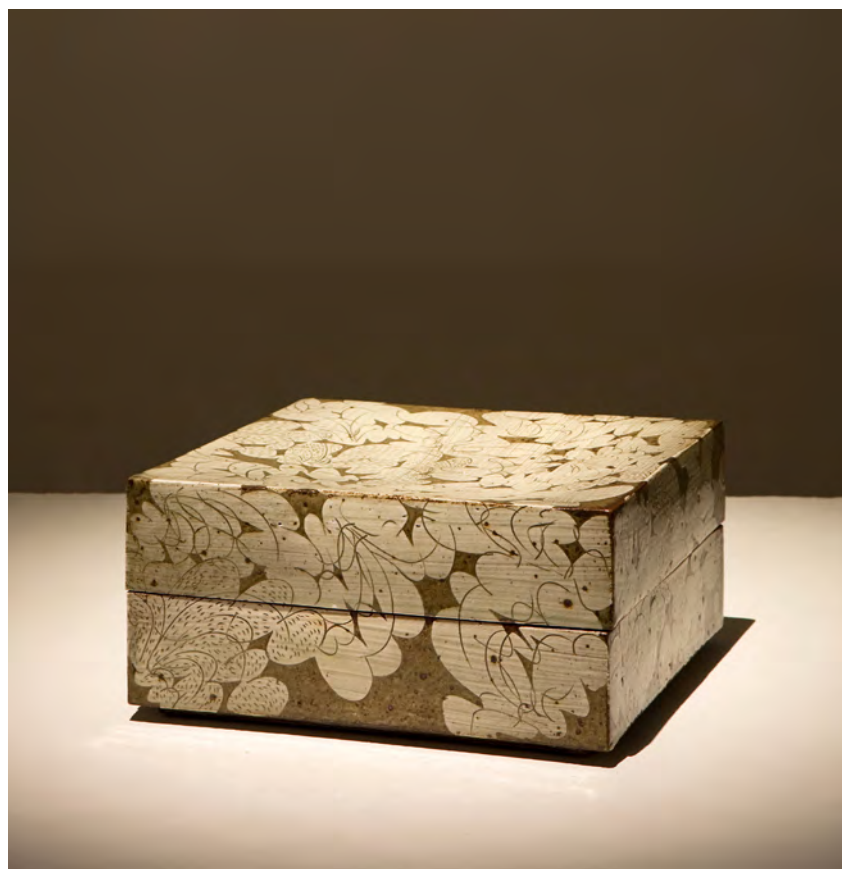
분청 박지문 2단합

24×24×11cm sand, engobe, bakji techniques 2006