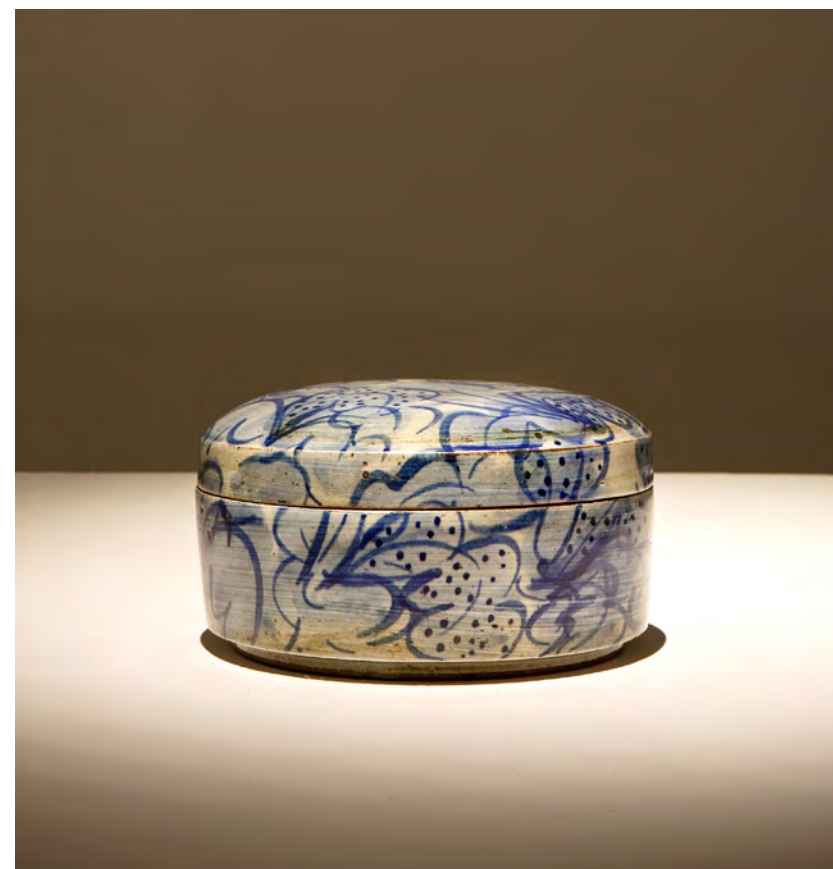
분청 청화장식 원형합

24×24×11cm sand, engobe, bakji techniques 2006