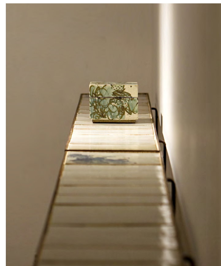
분청 청화장식 정사각합