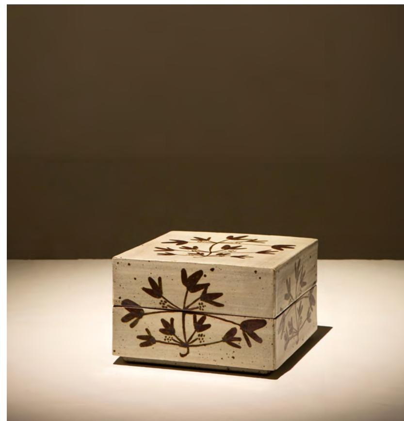
분청 철채 뽕잎 2단합

18×18×17.5cm sand, engobe, bakji techniques 2006