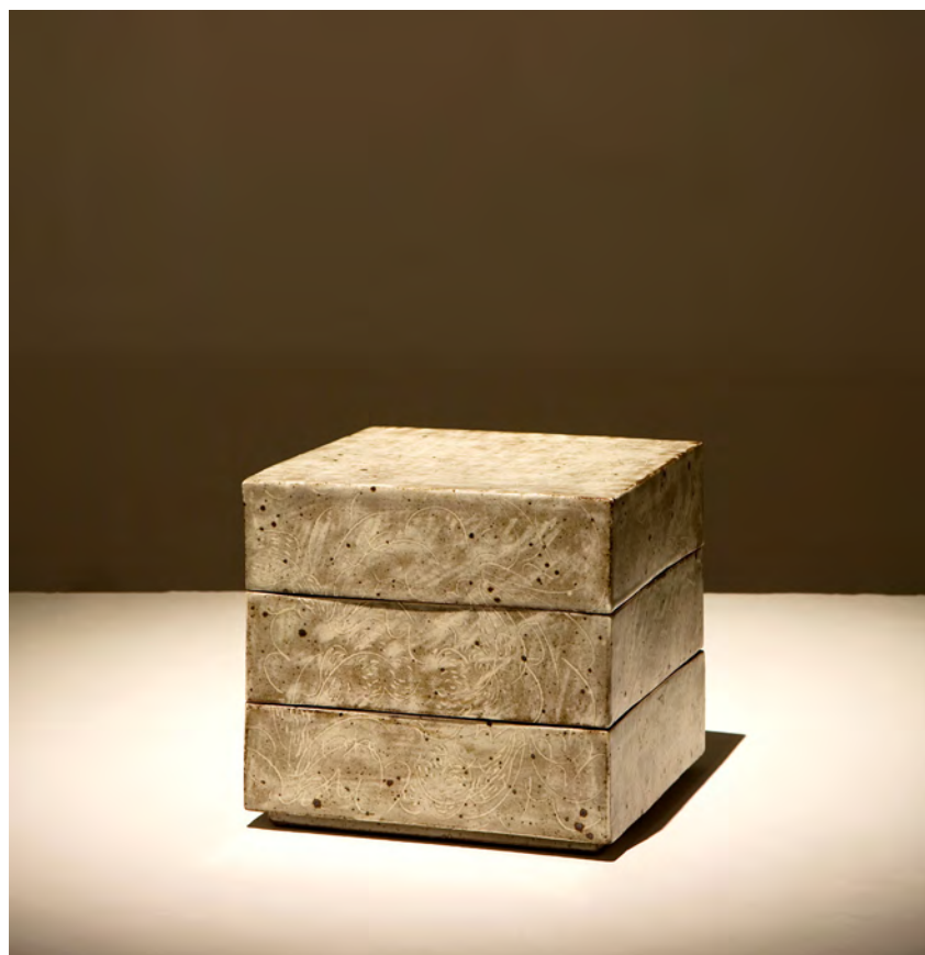
분청 박지문 3단합

18×18×17.5cm sand, engobe, bakji techniques 2006