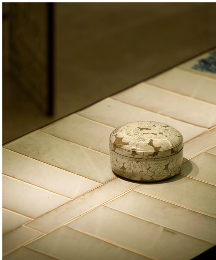
분청 사기 박지문 원형합

19R×10cm sand, engobe, bakji techniques 2006