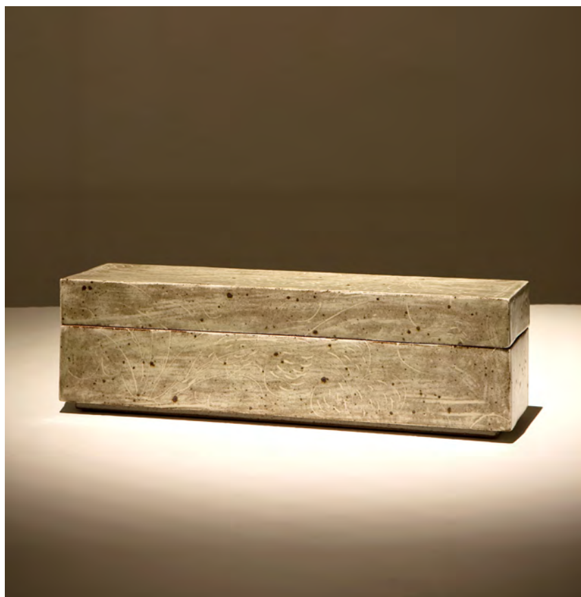
분청 박지문 직사각합

9.5×37×11cm sand, engobe, bakji techniques 2006