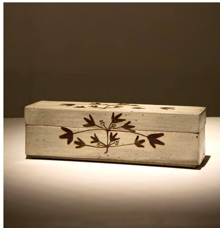
분청 철채 직사각합

9.5×37×11cm sand, engobe, bakji techniques 2006