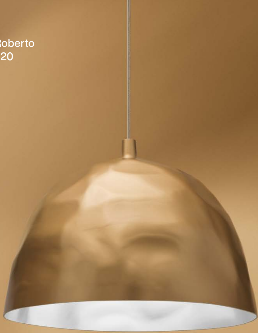
Bump Ludovica + Roberto Palomba, 2020