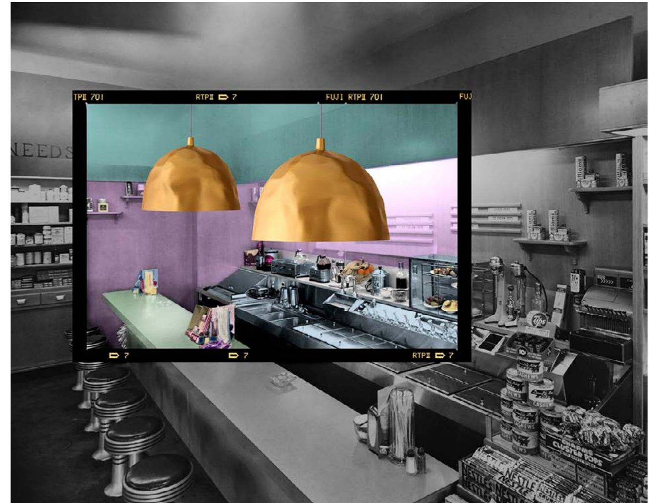
Interior of an empty diner.