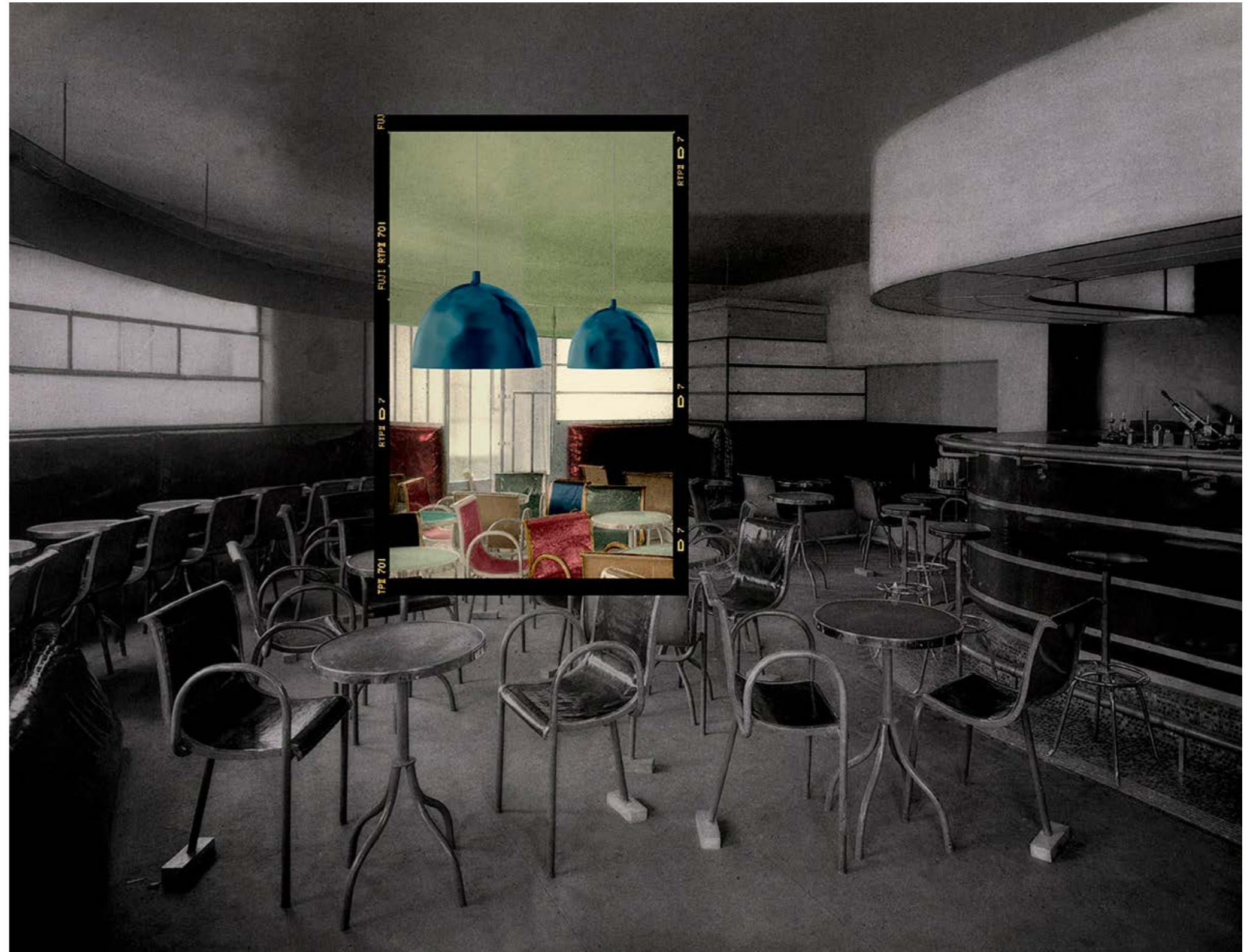
The Bar Diamand, designed by Charavel, Melendes and Colombier, 1920s.