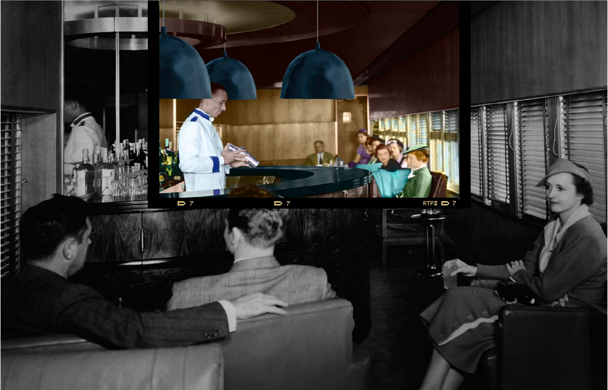
Cocktails On The Mercury Train, Detroit, Michigan, 1936.