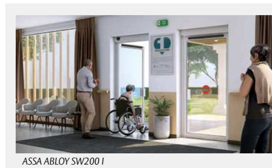
ASSA ABLOY SW200 I

Automatismi integrati con porte a battente In luoghi dove è importante avere un ingresso piacevole e accattivante.