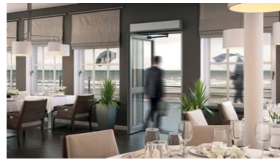
ASSA ABLOY Balance

Il sistema di porte rototraslante è progettato per funzionare in passaggi e corridoi stretti ed è particolarmente robusto per gestire un traffico intenso e resistere al vento, alle correnti e agli sbalzi di pressione. Disponibile con automatismo ASSA ABLOY SW100 e ASSA ABLOY SW200.