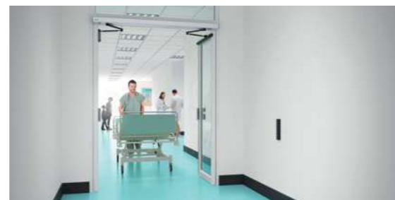
ASSA ABLOY SW300

Il sistema di porte a battente standard, robusto e affidabile, è adatto ad aree ad alto traffico. Le caratteristiche di sicurezza, come la protezione contro l'intrappolamento delle dita, e una scelta di opzioni per l'operatore, consentono di configurare questa porta in base all'applicazione.